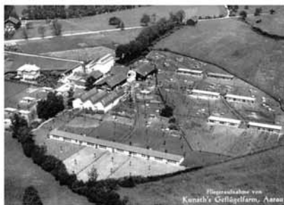
Kunath's Geflügelfarm (Heute KIFF)

Mit einer Foto-Ausstellung im Einkaufszentrum Telli möchten wir dokumentieren wie das Telli-Quartier früher ausgesehen hat.