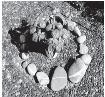
z.B. das Märchen „Der Basilikumtopf“