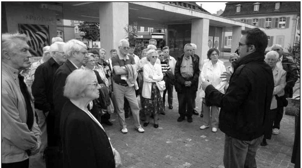
Stadtführung in Brugg

Auskunft erteilen gerne: Ulrich Graf, Tel. 062 822 17 33 Ahornweg 15, 5022 Rombach Rolf Schlegel, Tel. 062 823 76 96 Blumenweg 12, 5000 Aarau