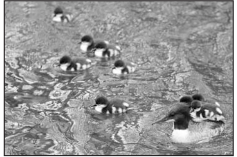
Gänsesäger Weibchen mit neun Jungen, drei davon im Huckepack.