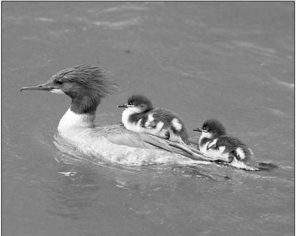
Gänsesäger Weibchen mit zwei Jungen im Huckepack.