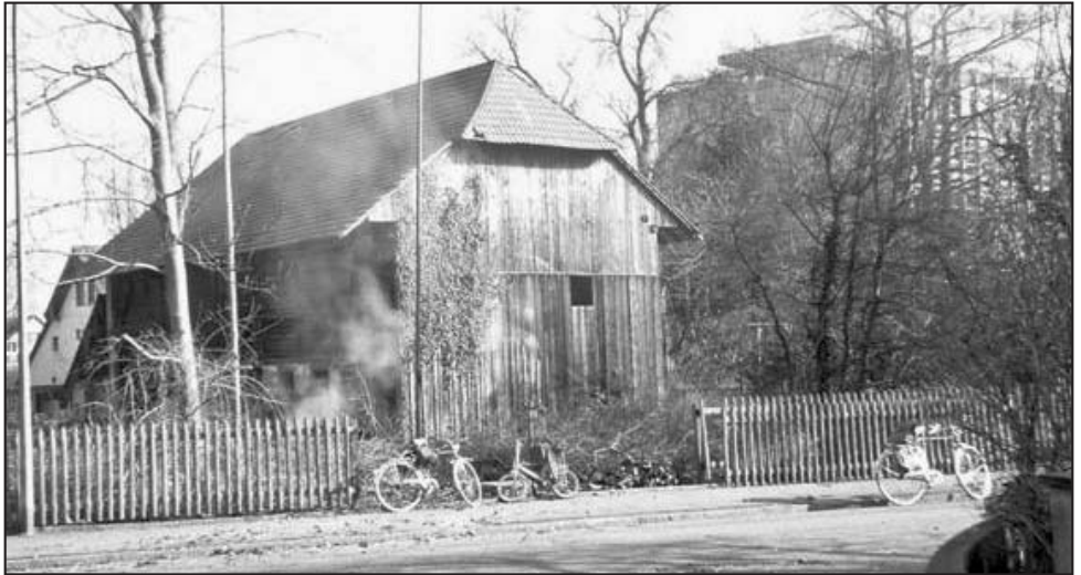
ehemalige chemische Fabrik 1980