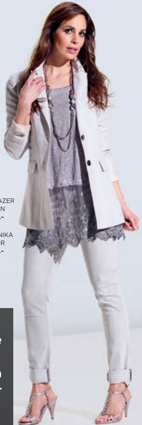
BLAZER IKON 189.- TUNIKA IBOR 129.-