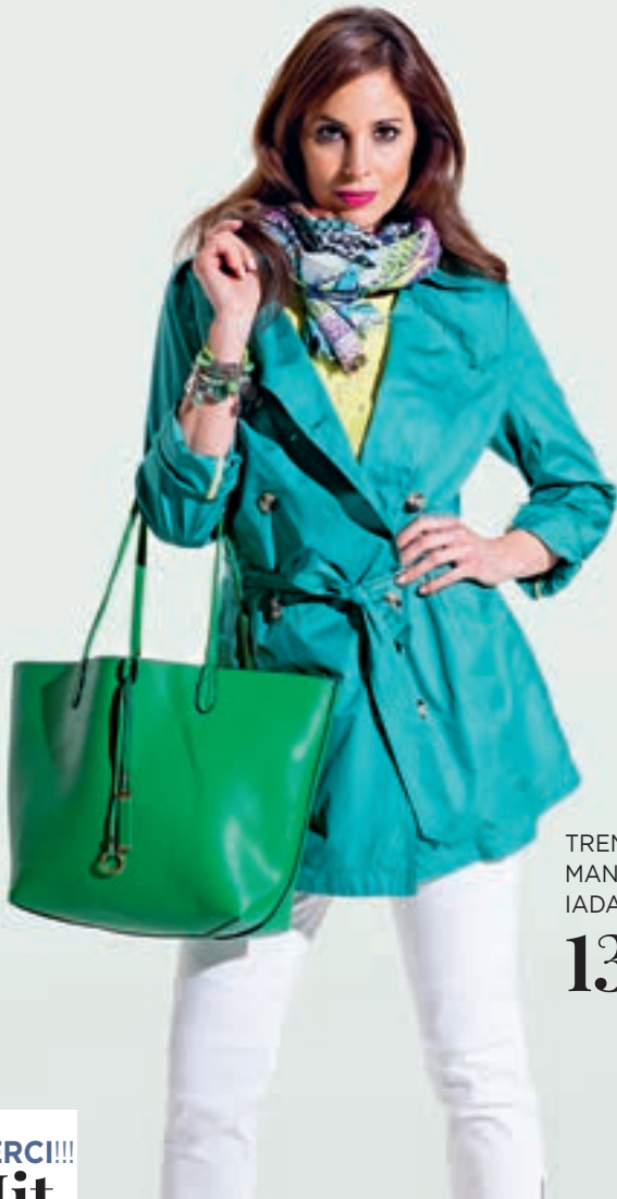
TRENCH- MANTEL IADA 139.-