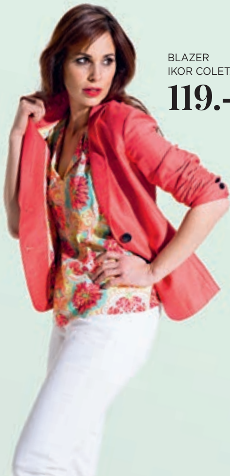
BLAZER IKOR COLETA 119.-

Ein Haus voll Mode und Accessoires - immer mit speziellem Design und herzlicher Beratung!